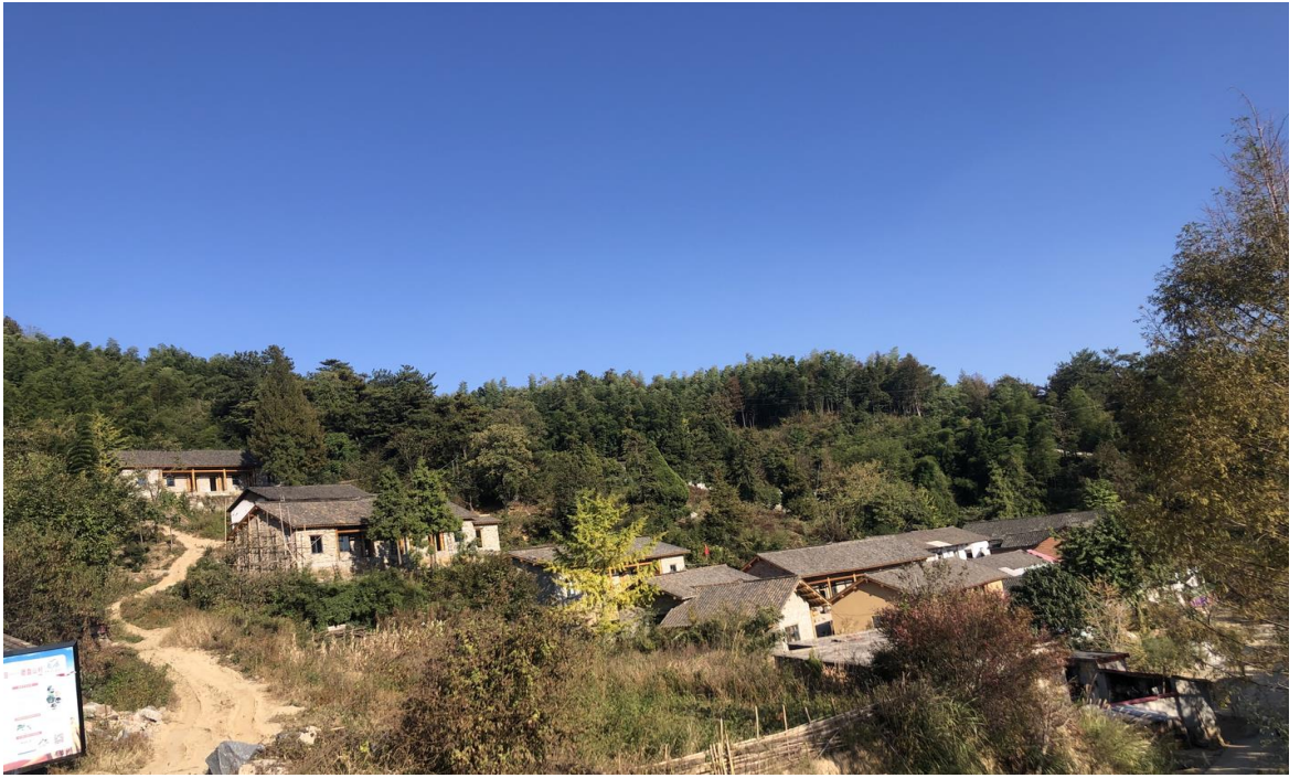
△ 绿树掩映

经过多方面调研论证，积极与中国扶贫基金会、国家电投集团对接，目前该县已争取国家电投集团河南电力有限公司定点帮扶资金1500万元，启动了磨盘山；在将磨盘山村打造成为集森林休闲度假、医疗养生养老、生态游赏、文化观光、山地休闲、森林康养度假等功能于一体的旅游区。