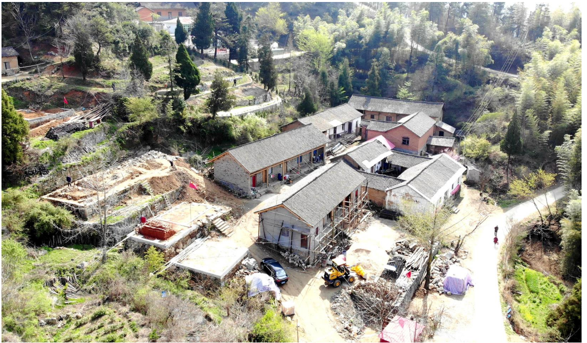
△ 磨盘山民宿

经过多方面调研论证，积极与中国扶贫基金会、国家电投集团对接，目前该县已争取国家电投集团河南电力有限公司定点帮扶资金1500万元，启动了磨盘山；在将磨盘山村打造成为集森林休闲度假、医疗养生养老、生态游赏、文化观光、山地休闲、森林康养度假等功能于一体的旅游区。