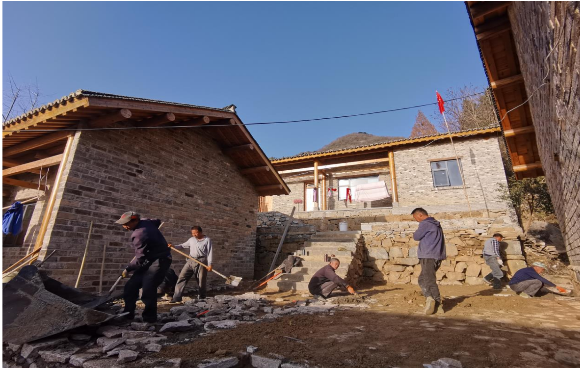
△ 紧张施工

据介绍，磨盘山民宿一期计划流转改造10套房屋，目前已完成8套房屋的主体建筑及硬装，预计2023年“五一”期间开始运营。今后该村还将建造以磨盘山服务中心，配置本地产品超市、书屋等功能；以民宅为主体，建设文创工坊，建设磨盘山当地特色菜餐厅、家常菜餐厅，为游客提供本地美食；打造磨盘山村乡系、小池塘、茶寮，复耕田地；运用绿色乡村技术，搭建智慧政务、农业、旅游、能源管控平台，为乡村发展提供绿色动能。