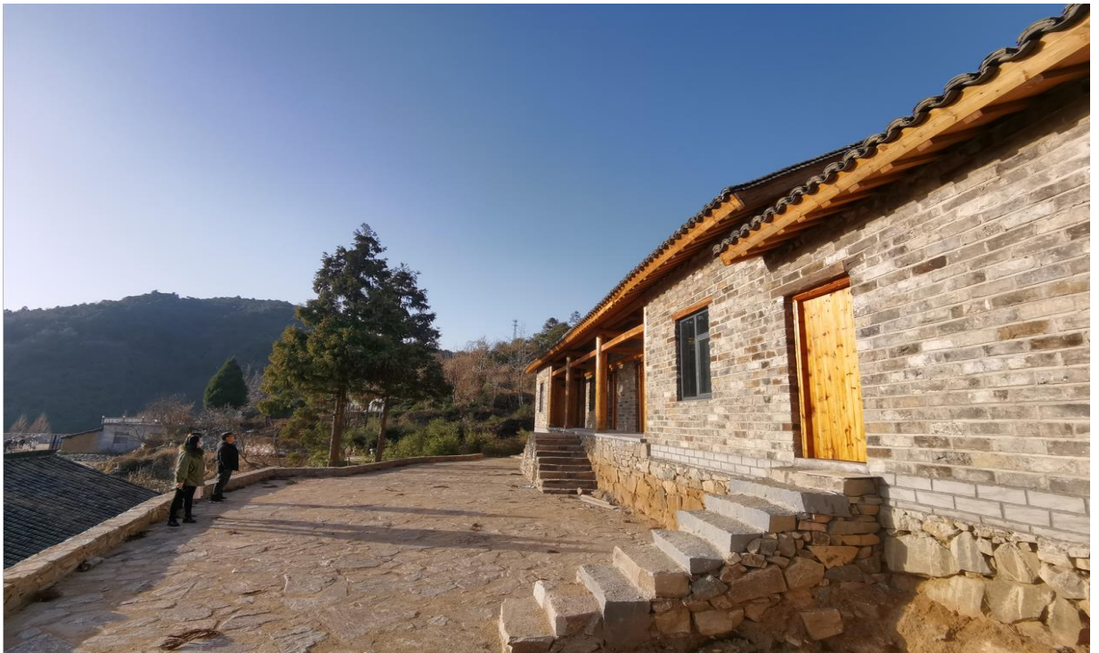
△ 渐具雏形

据介绍，磨盘山民宿一期计划流转改造10套房屋，目前已完成8套房屋的主体建筑及硬装，预计2023年“五一”期间开始运营。今后该村还将建造以磨盘山服务中心，配置本地产品超市、书屋等功能；以民宅为主体，建设文创工坊，建设磨盘山当地特色菜餐厅、家常菜餐厅，为游客提供本地美食；打造磨盘山村乡系、小池塘、茶寮，复耕田地；运用绿色乡村技术，搭建智慧政务、农业、旅游、能源管控平台，为乡村发展提供绿色动能。