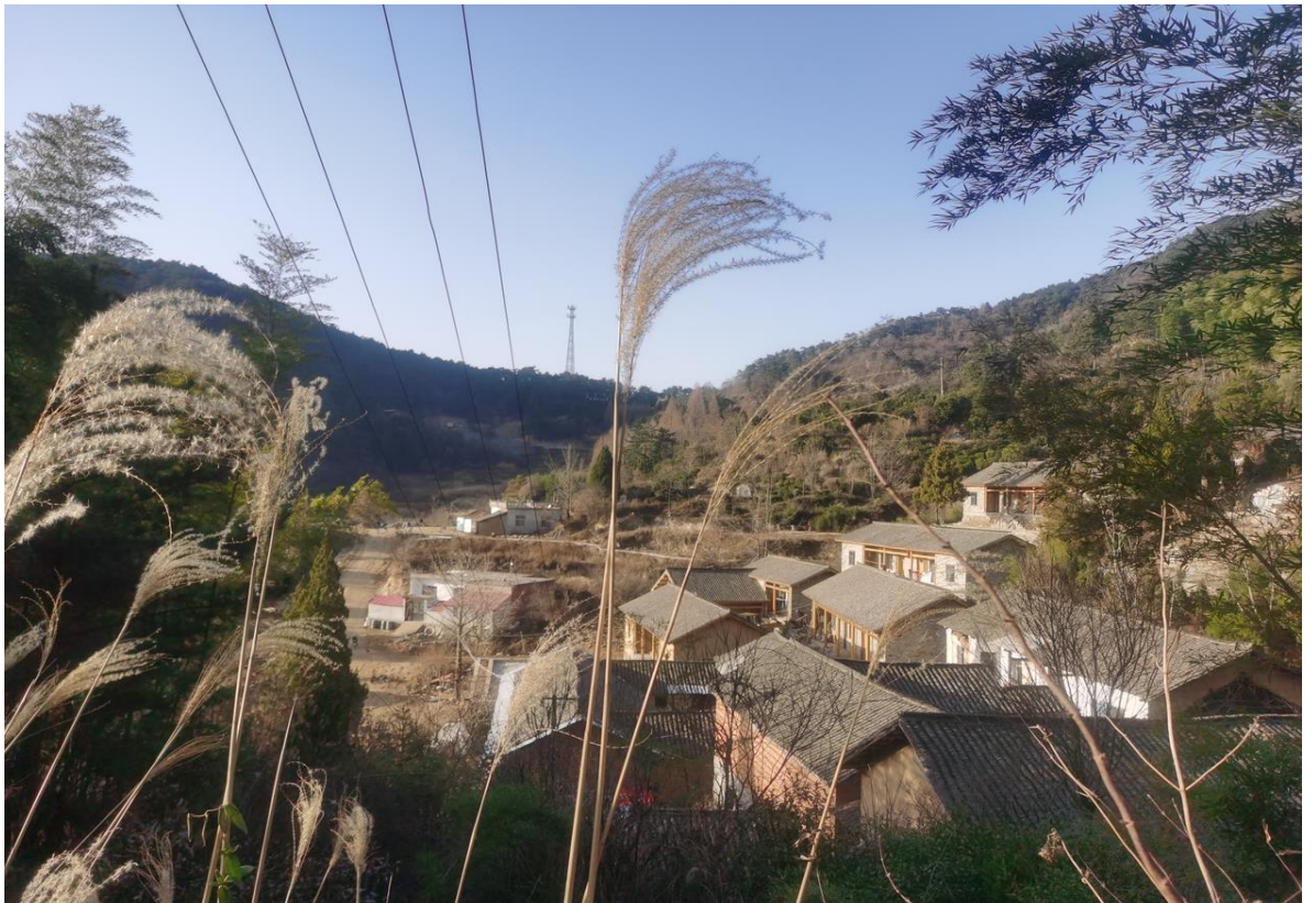
△ 群山环抱

“这个依偎在大山怀抱里的小山村叫磨盘山村。当前正在进行的是对群众闲置的房屋进行民宿改造，明年夏天就可以入住体验了。”进入村庄，跟随黄柏山林的介绍，拾级而上，村庄内房屋依山势而建、错落有致，部分民宿主体改造接近尾声，尽显古朴。